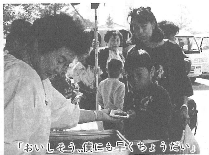
「おいしそう、僕にも早くちょうだい」