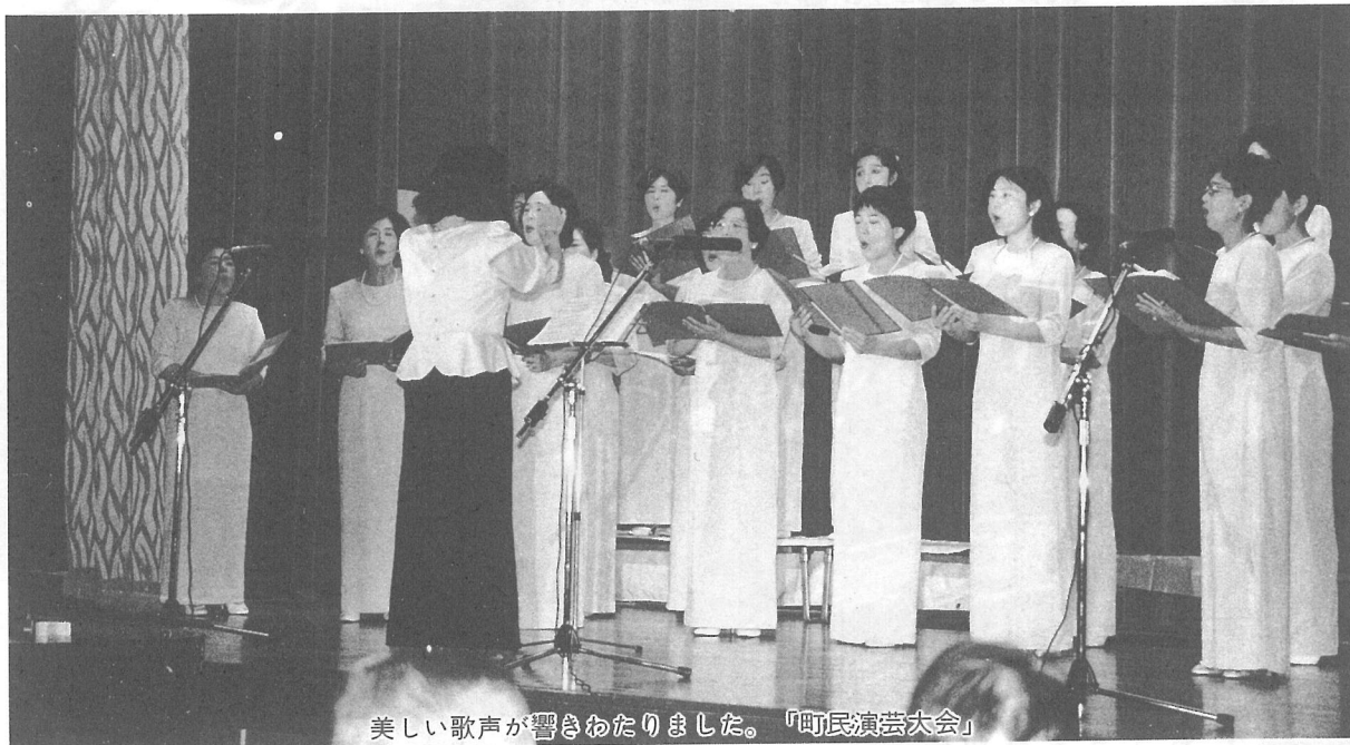
美しい歌声が響きわたりました。「町民演芸大会」