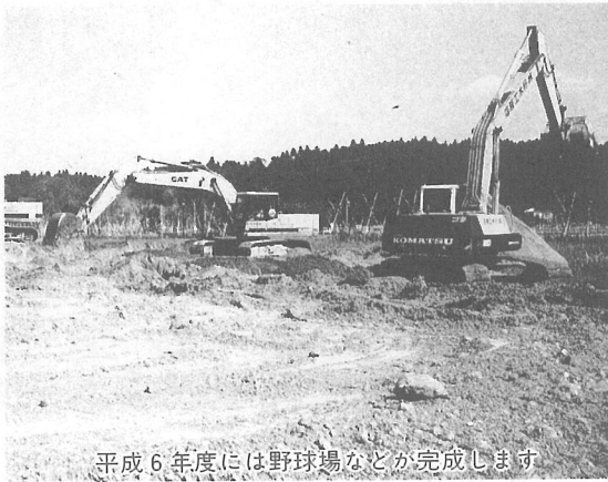
平成6年度には野球場などが完成します