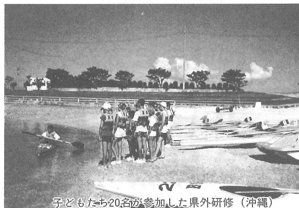
子どもたち20名が参加した県外研修(沖縄)