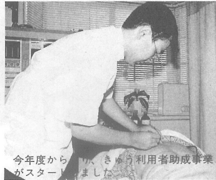
今年度から、きょう利用者助成事業がスタートしました。