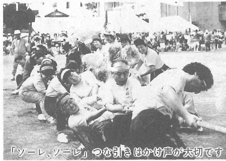
「ソーレ、ソーレ」つな引きはかけ声が大切です