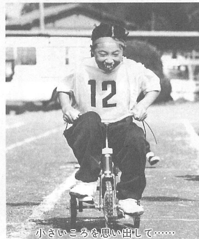
小さいころを思い出して……

秋晴れのもと「第23回町民体育祭」が盛大に行われ ました。 愛あい傘・ラッシュユアワの新しい競技、そして、 つな引き・ブロック対抗リレーなど毎年恒例の競技21 種目に選手のみなさんチャレンジです。 また、応援席では、仮装をして踊ったり、楽器を取 り入れた応援と各ブロック一段と趣向をこらし、わた したちを楽しませてくれました。 そんなみなさんをカメラで追ってみました。