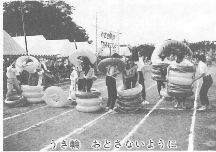
うき輪 おとさないように