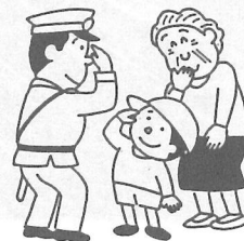
全国防犯運動 (10月11～20日)