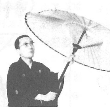
太神楽 かがみせんじゅろう 鏡味仙寿郎