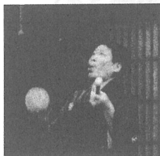
太神楽 おきな や わ らく 翁 家 和 楽