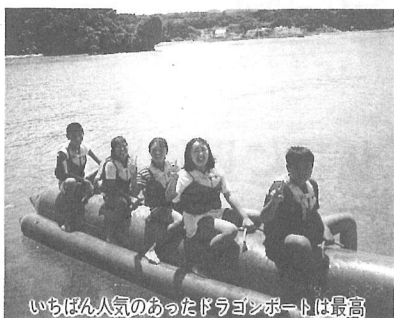
いちばん人気のあったドラゴンボートは最高

私が何といつても一番楽しかったのは、マリンスポーツです。カヌーやペダルボート、ドラゴンボートなど、初めて体験するものばかりでした。カヌーは、要領がなかなかわからなくて、始めは同じところをぐるぐる回ってしまいました。ですが、練習するうちにようやく直進できるようになりました。ペダルボートでは、他の人たちのボートと水でっぼうで水をかけあいました。追いかけることができず、必死になってペダルをこいでいました。マリンスポーツの中でも特におもしろかったのがドラゴンボートでした。真っ青な海の