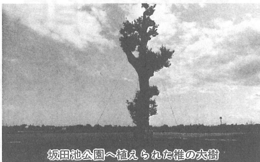
坂田池公園へ植えられた椎の大樹

問 カレドニアゴルフクラブで開催されたファイランズロピートーナメントは、社会福祉事業にどのような効果があったのか。 答 社会への貢献を目的の一つとして開かれたこの大会では、賞金総額の30%(3000万円)がNHKの厚生文化事業団を通じ、交通遺児のた