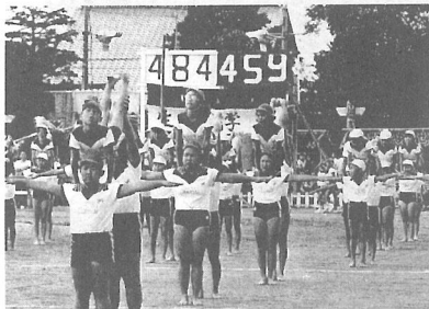
財特法は今後の町づくりに大きく影響

答 ①成田財特法は、空港周辺地域における公共施設等の計画的な整備を促進するため、国の財政上の特例措置で、昭和45年に制定された時限立