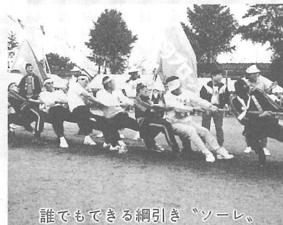
誰でもできる綱引き "ソーレ。"