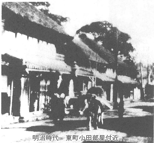
明治時代 東町小田部屋付近