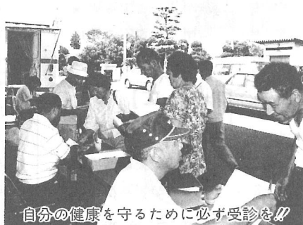
自分の健康を守るために必ず受診を!!

ヘリコプターによる 薬剤の空中散布は 7月10日・31日 8月1日の予定 です。 (天候により順延します)