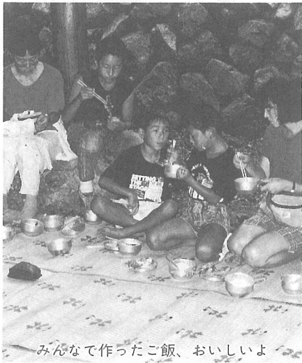
みんなで作ったご飯、おいしいよ