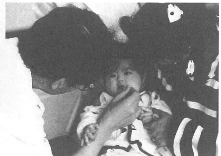
妊娠・出産・育児についての相談コーナーもあります

第1回目 ●とき 5月15日(金)午後1時30分～3時 ●場所 町文化会館 ※2回目からの参加も歓迎します。 また、2人目、3人目のお母さんも大歓迎です。お子さん連れどうぞ。申し込みは、町文化会館(☎01351)へ。