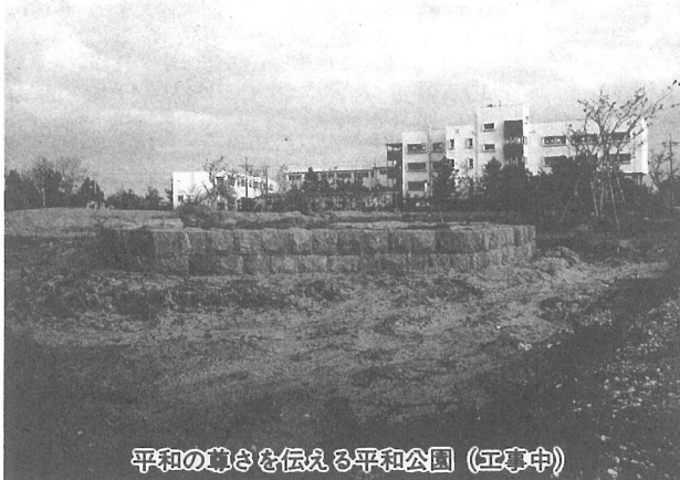
平和の尊さを伝える平和公園 (工事中)