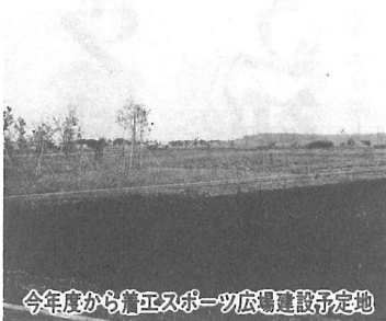
今年度から着工スポーツ広場建設予定地