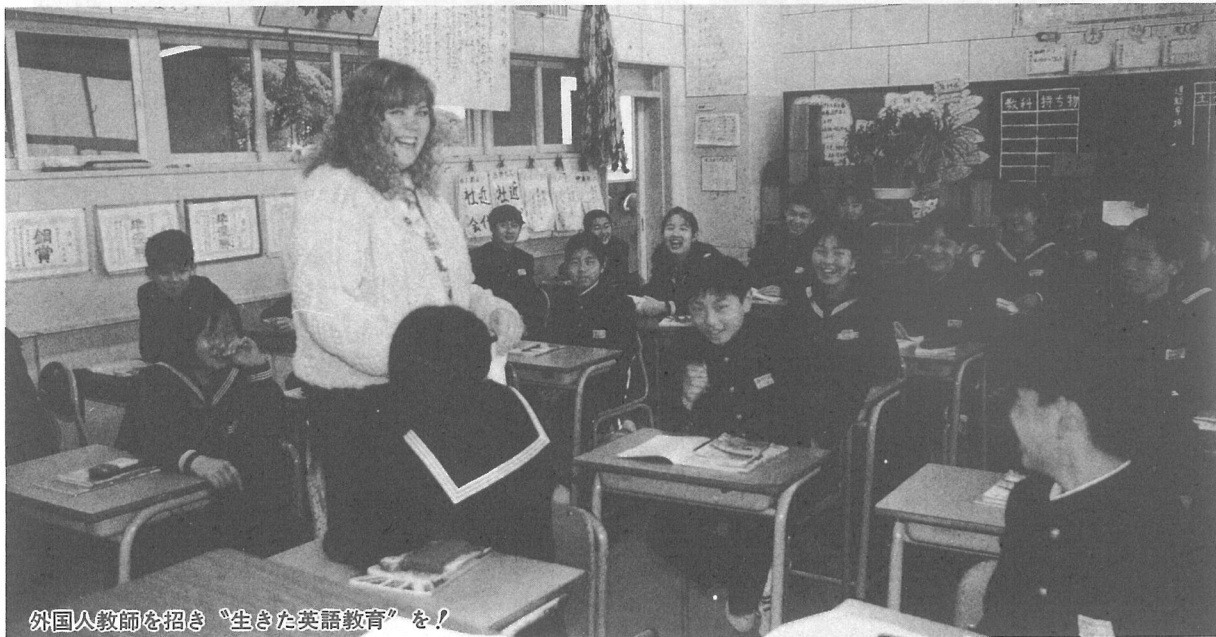
外国人教師を招き「生きた英語教育」を!