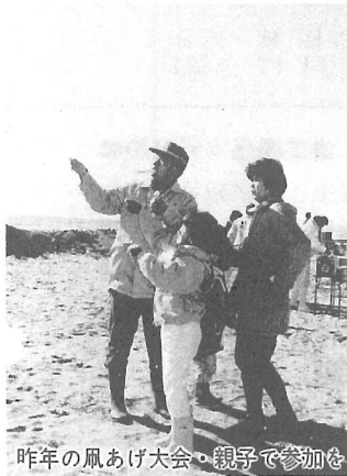
昨年の凧あげ大会、親子で参加を

町中央公民館では、「新年子ども凧あげ大会」を行います。当日は、宝さがしや青少年相談員さんによる大凧（畳3畳分）あげがありますので、多数の参加をお待ちしています。 ●とき 1月12日(日) 午前9時30分から ●場所 屋形海岸 ●お問い合わせ先 12月28日～1月4日は役場、1月5日以降は町文化会館（☎1351）へ。 ※どんな凧でも結構ですが、手作りのものに限ります。