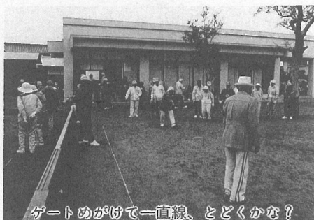
ゲートめがけて一直線、とどくかな？