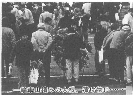
一輪車山積みの大根、漬け物に

ました。なかには、軽トラック1台分の大根を買い、助手席に乗ってそのまま自宅へ、という人も。