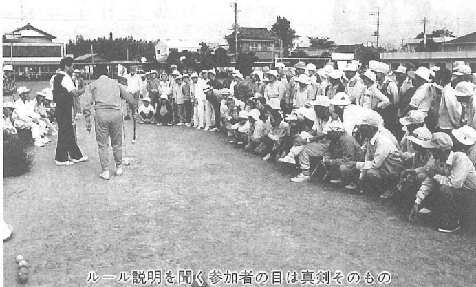
ルール説明を聞く参加者の目は真剣そのもの