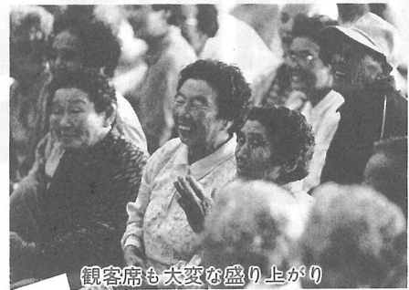
観客席も大変な盛り上がり