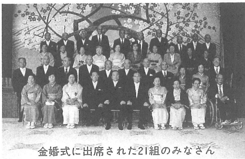
金婚式に出席された21組のみなさん

今年金婚式を迎えられたみなさんは、いずれも戦時中に結婚なされたご夫婦で、中には、「つらいことも数多くあったが、今となればみんないい思い出です。」と当時を懐かしく語ってくれる人が。また喜びを隠せないご夫婦もいて、「一口に50年と言いますが、