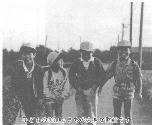
子どもの笑顔もまちの大きな財産です。