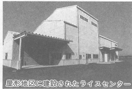
屋形地区に建設されたライスセンター

ため、運営費の一部を補助。 また、高生産性農業用機械施設（格納庫1棟、トラクター2台）を導入し、農業、農村の活性化を図る同組合に、その費用の一部を補助します。 〔2280万5千円〕