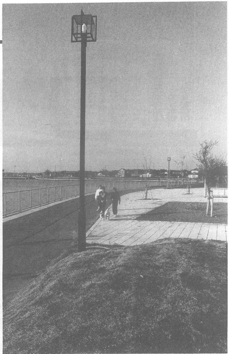
次の日曜日には、出かけてみませんか 坂田池ふれあい公園一部開放 (関連記事20ページ)

あい公園(仮称)は、すでに、県道沿いと池の南側の区域が利用できるようになったほか、坂田池の北側から西側の区域の一部も完成し、樹木などの養生期間に入っています。