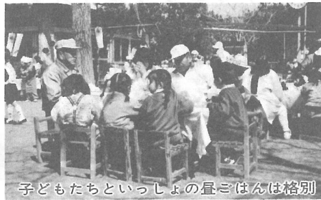
子どもたちといっしょの昼ごはんは格別