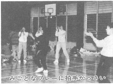
みことなプレーに拍手がっさい

2月17日(日)、海洋センターで第20回婦人バトミントン大会が行われ、個人戦に26チーム(52名)、団体戦に9チーム(58名)が参加。 お母さんたちは、小さな羽根を夢中で追いかけていました。そばでは、子どもたちも負けじとばかりラケットを振っており、終始笑いの中で熱戦が展開されました。