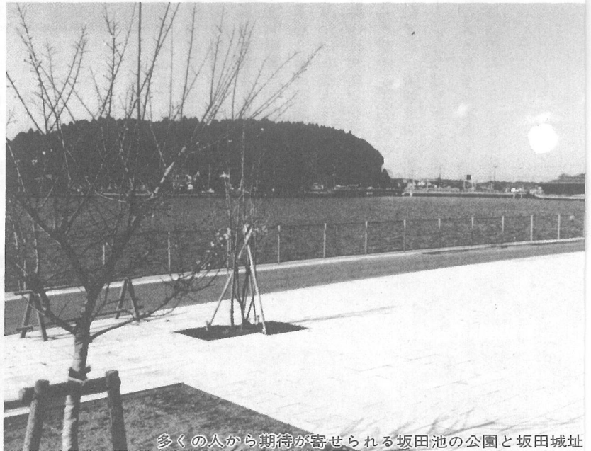
多くの人から期待が寄せられる坂田池の公園と坂田城址

どの事業をとつても、今ある自然を損なうことなく、計画的で、きれいなまちづくりにつながることを求められています。