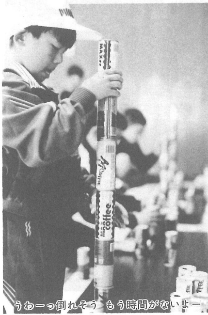
うわっ倒れそう もう時間がないよー