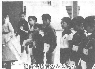
記録保持者のみなさん