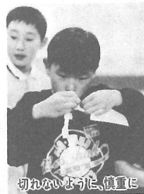
切れないように、慎重に

学校の休み時間などを利用して、友達と練習をした。今日の出来はよかった、来年も挑戦してみたい。