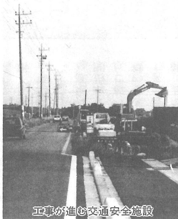
工事が進む交通安全施設