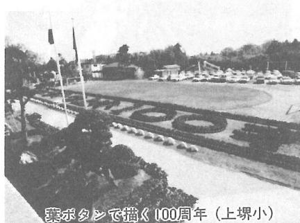
祭ポタで描く100周年(上堺小)