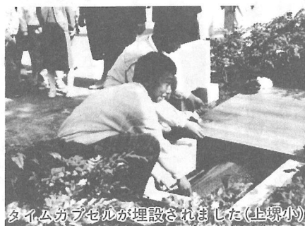
タイムカプセルが埋設されました(上堺小)