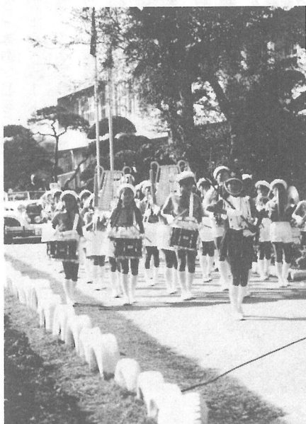
パレードに鼓笛隊も華をそえて(上堺小)