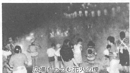
広場をつつむ花火の煙

ベントとして捉えるのではなく、まさに「地域復興」への原点として、しっかりと握りかえたいものです。(K)