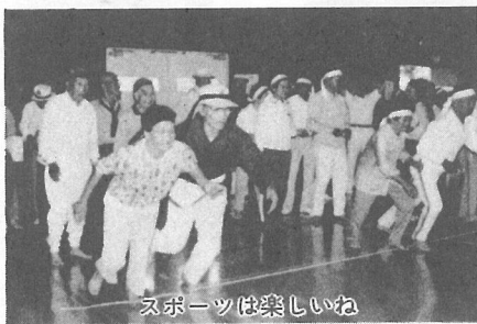
スポーツは楽しいね

「うわー、がんばれ」声援が飛び交う体育館。町老人スポーツ大会が10月3日(休)海洋センターで行われ、競技している姿は若人のように元気いっぱいでした。