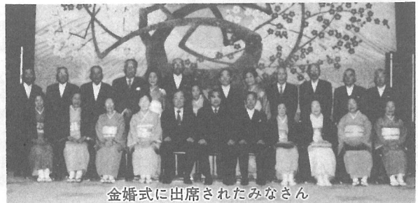
金婚式に出席されたみなさん

10月12日(金)、今年結婚50年をお迎えしたご夫婦をお祝いして金婚式が行われました。戦中戦後を経て、永い年月をお過ごしになった方々です。