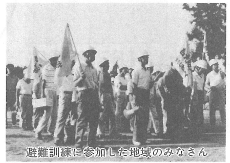
避難訓練に参加した地域のみなさん

自分の住む地域を近所同士助け合い、力を合わせて災害に立ち向かえば、被害を最小限に引き止めることができるはず。 ひとつたび大災害が起つたときに、私たちを守るのは、隣近所との円滑なコミュニケーションと、こうした私たち自身の地道な努力なのです。 「自分たちの地域は、自分たちで守る」意識のもと、日ご