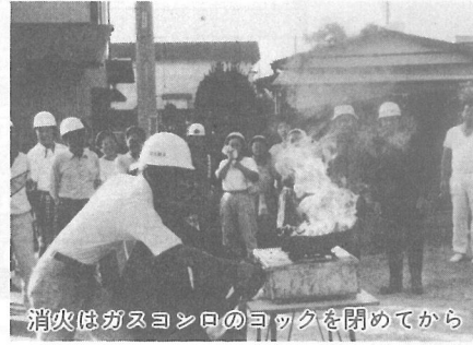
消火はガスボンブのヨックを閉めてから

主会場の栗山地区では、担架を使つての救出訓練や消火訓練などが行われ、また、避難所に当てられた各集会所などでは、非常食用のキャンパンと水を試食しました。 町では、万一の災害に備え少しでも被害を少なくするため、自主防災組織づくりをすすめてきましたが、今年の栗