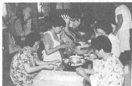
祭りの裏方さんは大忙し (上町)