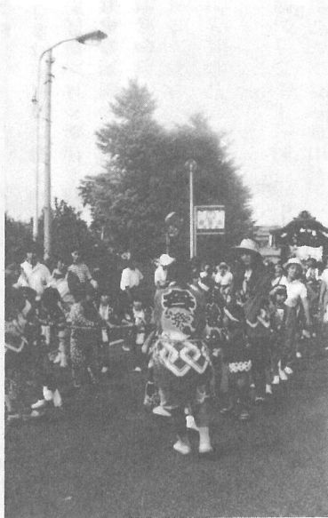
本町の山車は母子でファイト