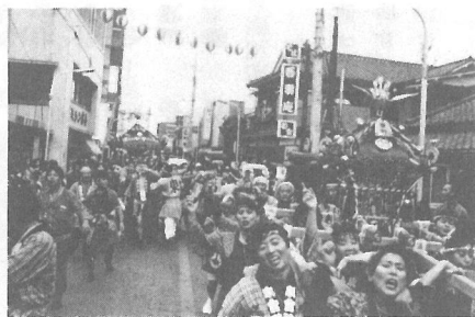
お母さんみこしも大ハッスル (東町)