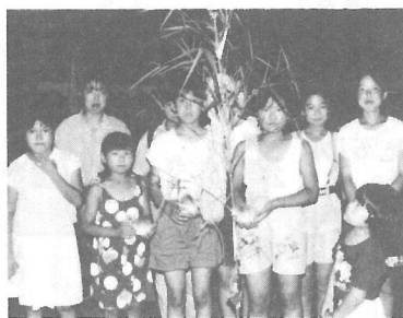
虫送り当日「ツトコ」の中にご馳走が入られ門脇に吊るされます