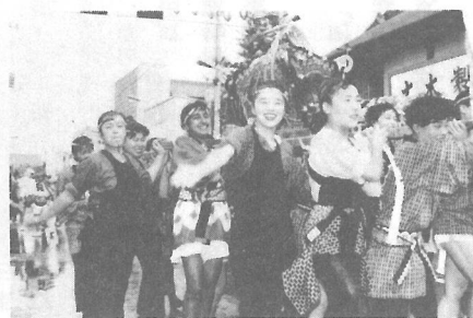
交歓留学生も飛び入りでワッショイ (上町)