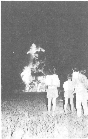
古くから稲作にかかわる農耕儀礼「虫送り」(坂田)