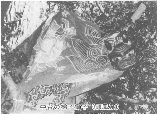
中台の梯子獅子（鎮風祭）

一方、鳥喰地方にも「大神楽」の獅子舞があつて、毎年正月に、熊野神社に奉納されています。今年は、一月十五日の新年会の席上地元の方々によって舞われました。 すでに消滅したものととしては、屋形の「郷中祈禱」の獅子舞があり、その復活が期待されています。