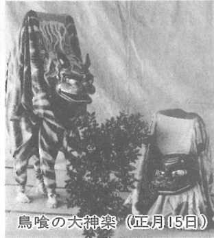
鳥喰の大神楽（正月15日）