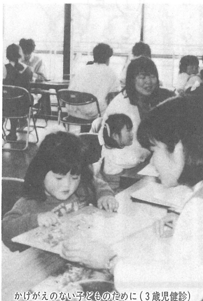
かけがえない子どものために(3歳児健診)