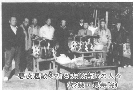
悪疫退散を祈る大般若経の人々 (於幾・長寿院)

一見、のどかな行事のようですが、そこには昔の人々の「健康を祈る」真剣な生活態度が残されています。