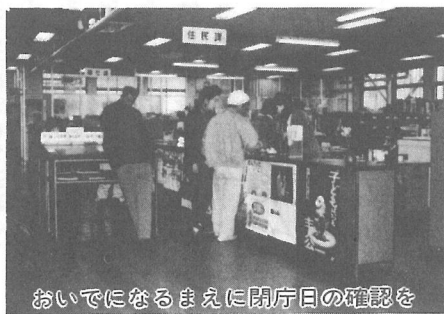
おいでになるまえに閉庁日の確認を

保育所 文化会館（各種学級講座、図書室） 海洋センター（体育館、プール、テニスコート）