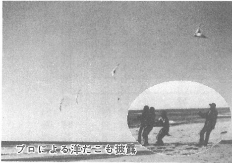
プロによる洋だこも披露

自慢のたこを手にした子どもたちは、受付を済ませると我先にとたこ上げに挑戦。ときには、折からの強い風におられ、糸が切れて海に落ちたりこわれるなど、悪戦苦闘する一幕もありましたが、大自然とのふれあいを満喫して