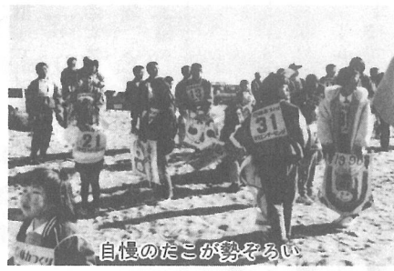
自慢のたこが勢ぞろい