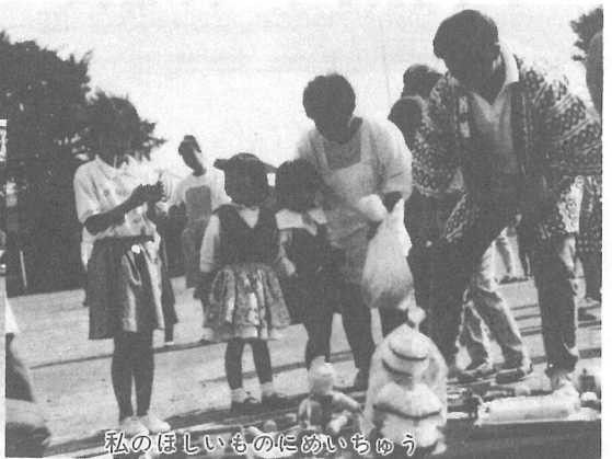
私のほしいものにめいちゆう