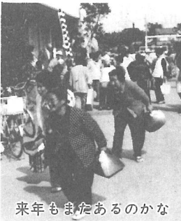
来年もまたあるのかな