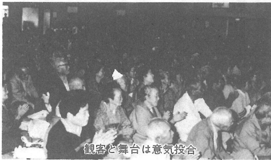
観客と舞台は意気投合