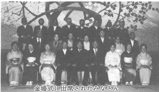
金婚式に出席されたみなさん

出席された人の中には、「結婚して50年を迎えたなんて、ゆめみたいですよ。」「東京にいたんですが、戦争でB29の空襲にあつて、よくこま