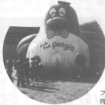
フワフワペンギンの中が 待ちどうしいわ