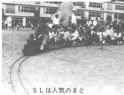
S L は人気のま