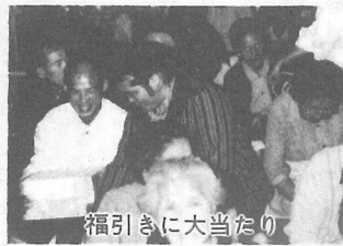
福引きに大当たり