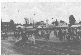
↑各ブロックの期待を背負っての選手の力走 (ブロック対抗リレー)