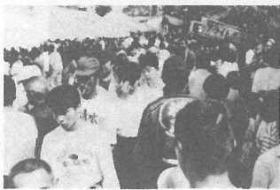
◀観客はいつもの年の2倍?