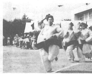
◀わたしたち、本当はスマートなんですよ…