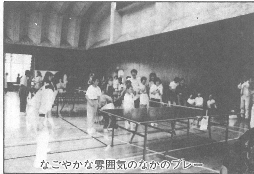
なごやかな雰囲気の中でのプレー