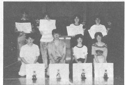
個人の部で入賞したみなさん