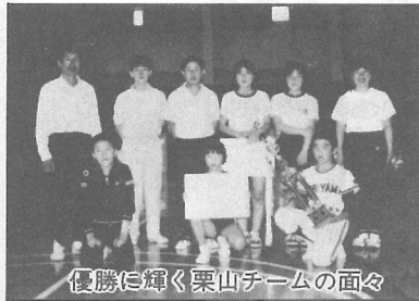
優勝に輝く栗山チームの面々