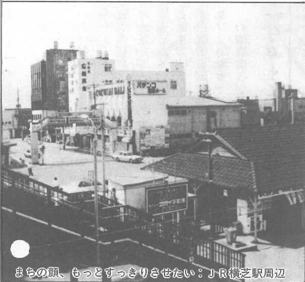
まちな顔、もっとすっきりさせたい：JR横芝駅周辺

とや、財政的にも巨費が必要なことから、町独自で検討を加えながら、基本的には、県道として実施できるよう強力に要望していきたい。