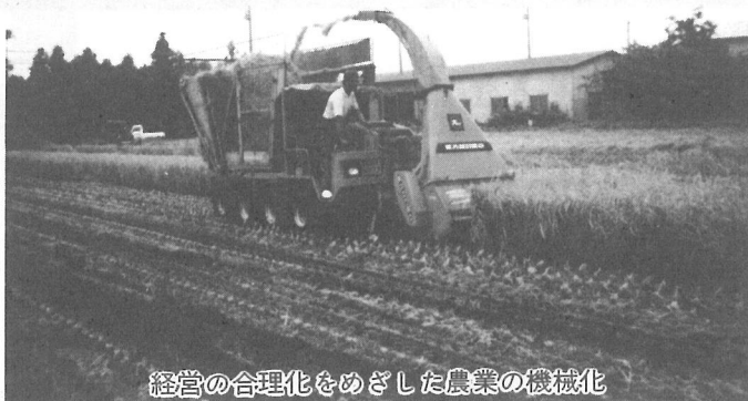
経営の合理化をめざした農業の機械化