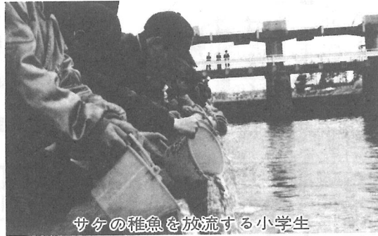
サケの稚魚を放流する小学生

2月29日、上堺小学校と横芝小学校の子どもたちが、母なる川、栗山川にサケの稚魚を放流しました。 漁業開発への期待をかけて始められたこの事業も今年で12回を数え、今回はなんと100万尾。 「北の海で友達をたくさんつくってね。そしてみんな帰ってきてね。」と再会の願いを込めているようでした。