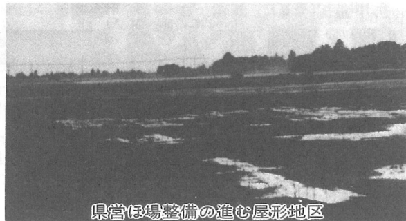
県営ほ場整備の進む屋形地区