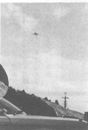
3月6日車を直撃した水塊(遠山)

①空港との共存共栄をめざしてきたわが町にとって、航空機からの落下物は深刻な問題だ。今後どのような対策を講ずるのか。