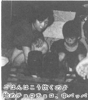
さはんはこう炊くのよ 始めテヨロテヨロ、中パッパ

8月24日、25日、楽しい夏休みの思い出にと企画した町民キャンプは、9家族（28名）の参加を得て、道志川の清流に沿った神奈川県神奈川県の休緑村青根キャンプ場で行われ