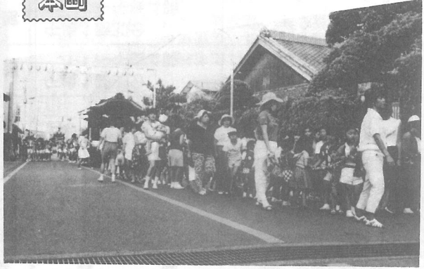
たくさんの子どもたちが山車引きに加わりました