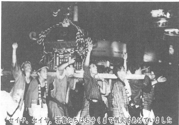
セイヤ、セイヤ、若者たちはおそくまで気炎をあけていました