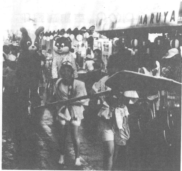
ぬいぐるみはいつも子どもたちの人気者