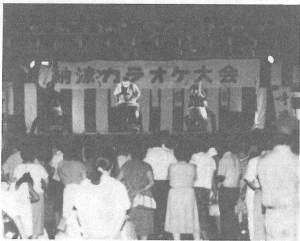
舞台では太鼓の早打ち披露