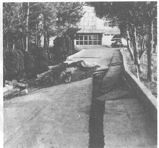
砂の移動によって生じた道路陥没（長南町）