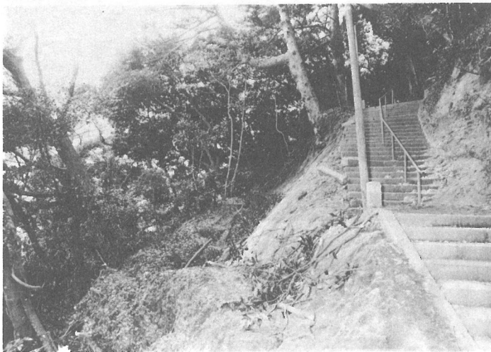
浅間神社の土砂くずれ現場（松尾町）