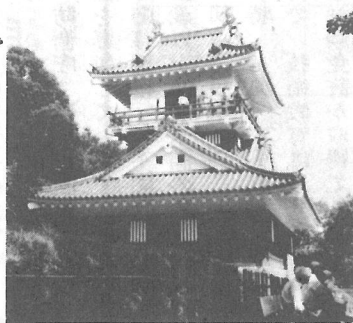
昭和54年に復元された上総の名城、久留里城天守閣

6月15日の県民の日には、富津市の東京湾観音、マザー牧場や君津市の久留里城等をめぐるバスツアーを実施しました。28名の参加者は真夏を思わす陽光のもと、房総の魅力存分に満喫しました。