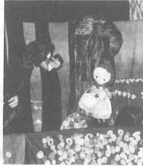
どこへ行くんだい

子どもたちはあかずきんの味方。悪いオオカミをやっつけようと大声援。みんな童話の世界に浸っていました。