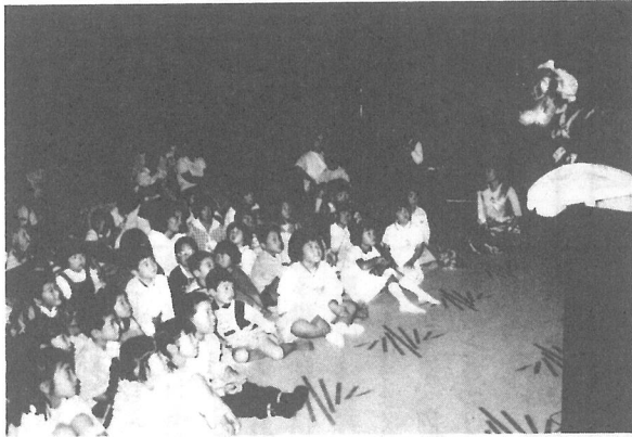
人形劇を楽しむ子どもたち