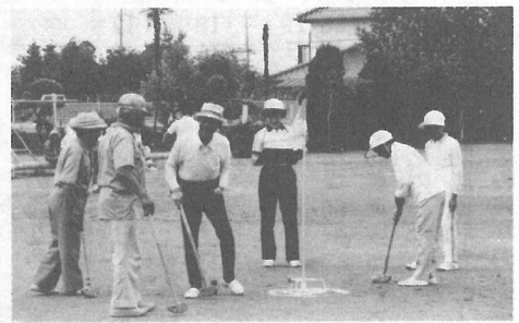
なかなか、むずかしいもんだ

気軽に楽しめるグランドゴルフ。当日は、子どもからお年よりまで大勢が参加し、「ふれあい広場」でさわやかな汗を流しました。